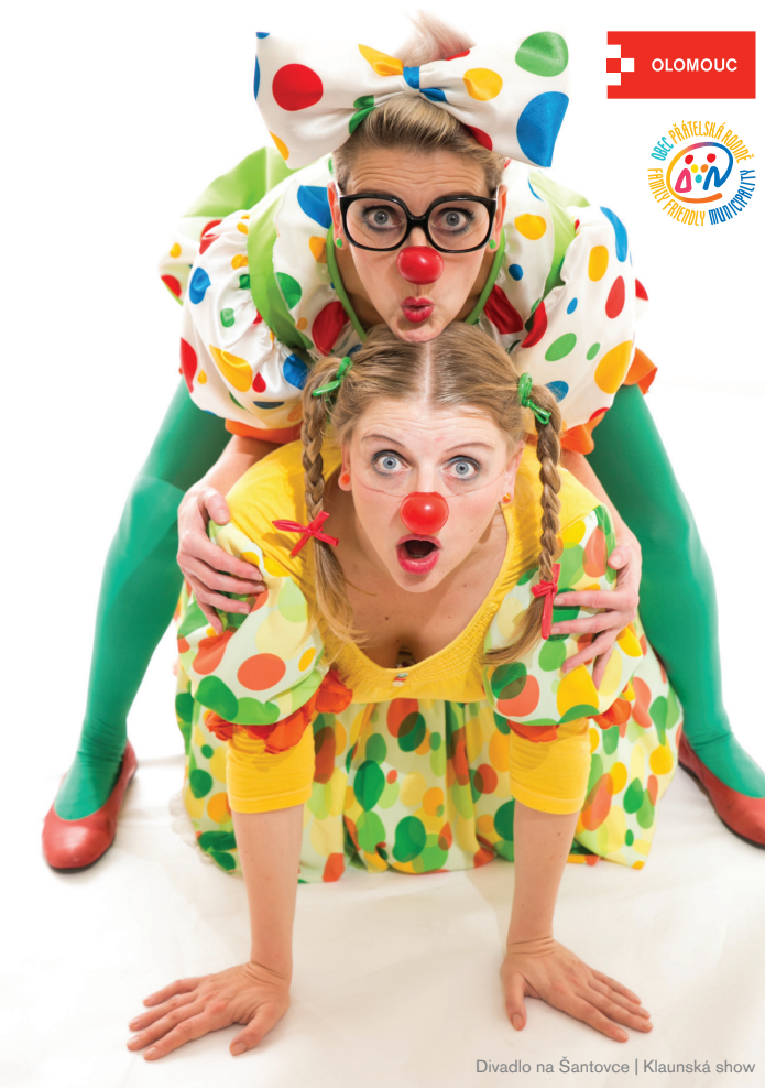
Divadlo na Šantovce | Klaunská show

www.prorodinu.olomouc.eu | tourism.olomouc.eu