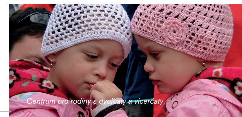
Centrum pro rodiny s dvojčaty a víčerčaty

Vydalo statutární město Olomouc, 2017