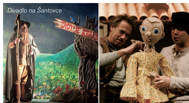
Divadlo na Šantovce

Pobočka Brněnská – akce pro děti alespoň s jedním rodičem, prarodičem či sourozencem. Vyhrává nejrychleji ukončená hra.