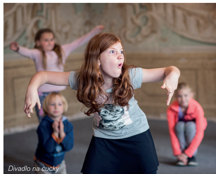
Divadlo na cucky

Letní tábory: Na rok 2017 je připraveno více než 30 letních táborů. V nabídce jsou příměstské tábory, pobyty v přírodě,